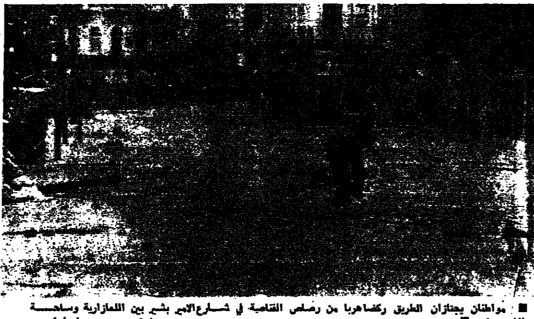
مواطنان يجتران الطريق وكما هربا من رصاص القناصة في شارع الابرج بسج بين الممازرة وسماحة الشهداء